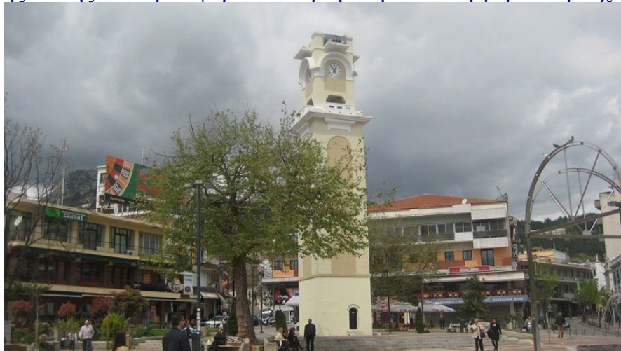
Ο διάσημος πύργος με το ρολόι.

Ο διάσημος πύργος με το ρολόι, γνωστός ως «Παλιό Ρολόι», αποτελεί σύμβολο του παρελθόντος της πόλης και προσφέρει πανοραμική θέα στη γύρω περιοχή.